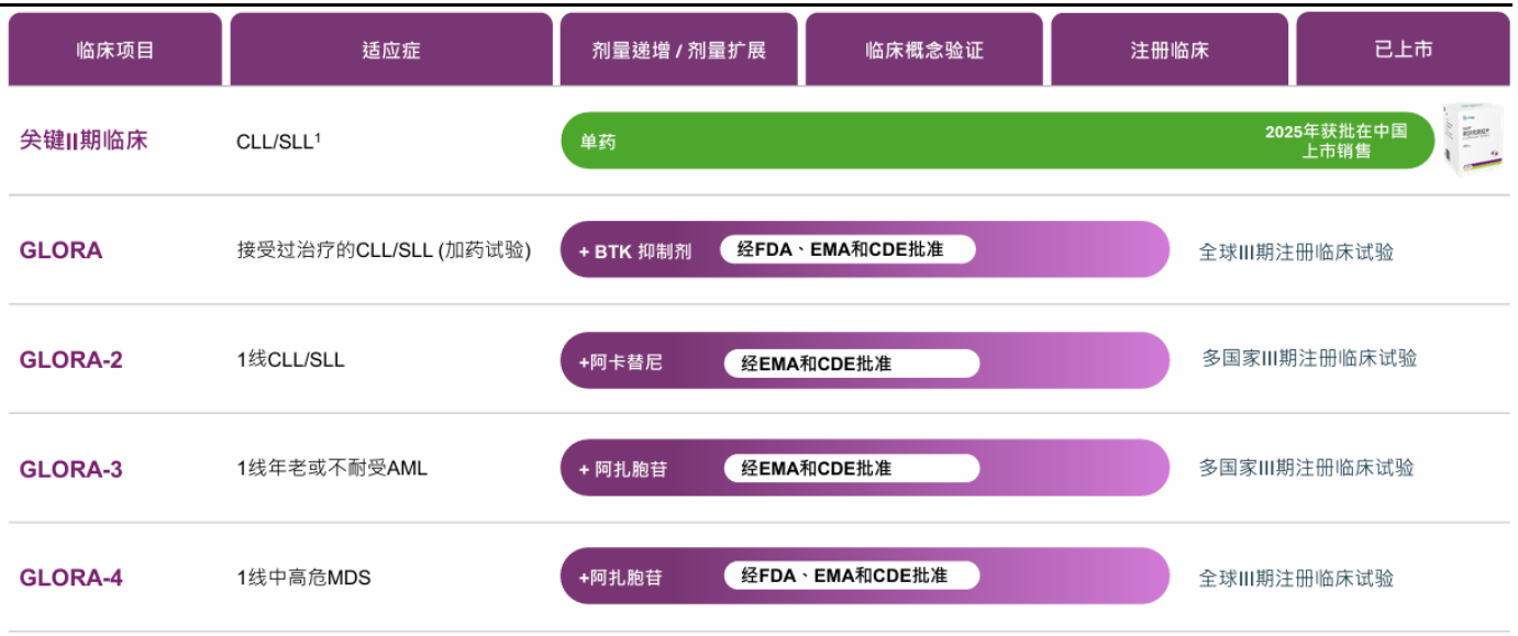
图 1：利沙托克拉全球临床进展情况

国内多中心真实世界研究 (30 例患者)，利沙托克拉治疗 AML 患者 CR/CRi 高达 72%，其中 ELN 低危组疗效最佳 (87%)，首次达到 CR/CRi 的患者 MRD 阴性率达 61%。NPM1 突变患者 CR/CRi 率 100%，IDH2 突变患者 83%。安全性可控，主要为血细胞减少。该数据为 GLORA-3/GLORA-4 的临床价值提供强有力佐证。