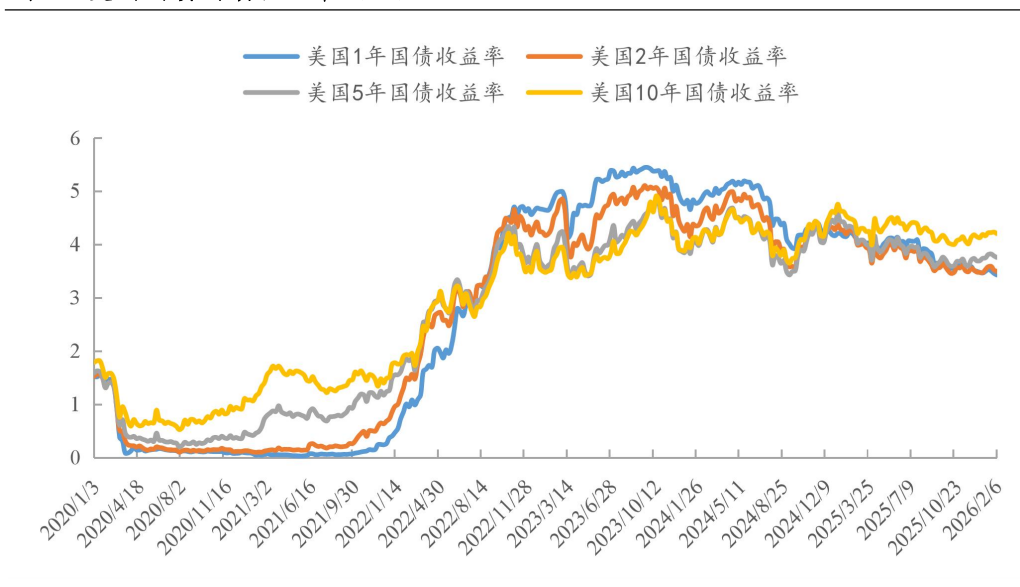
图 4：美国国债到期收益率（%）