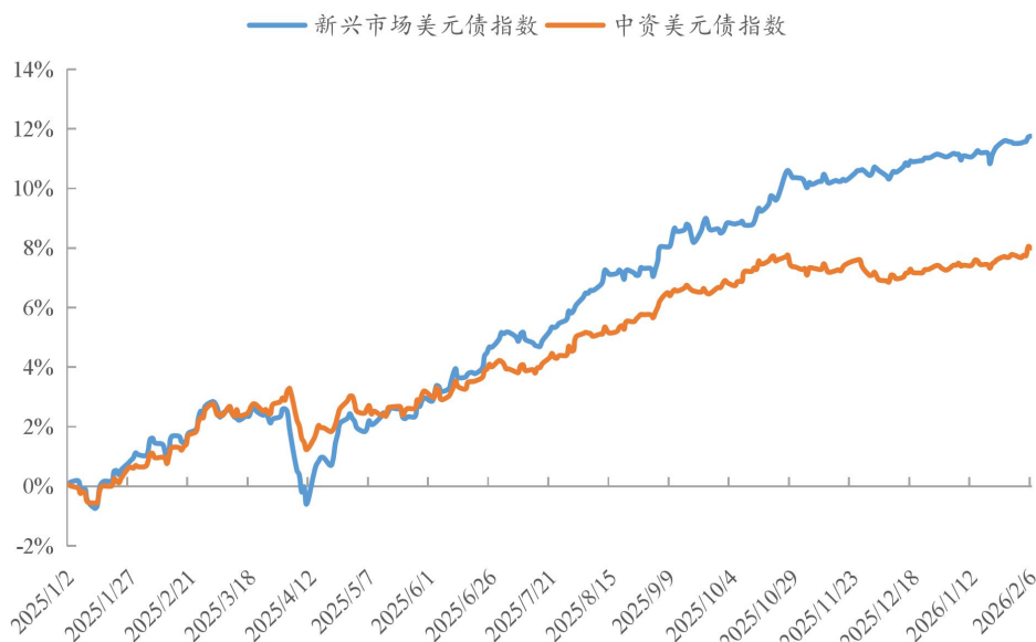
图 1：中资美元债收益与其他市场比较

注：以 2024 年 12 月 31 日为基点