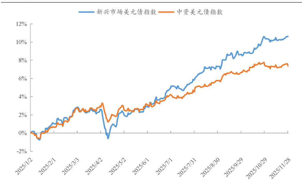
图 1：中资美元债收益与其他市场比较

注：以 2024 年 12 月 31 日为基点