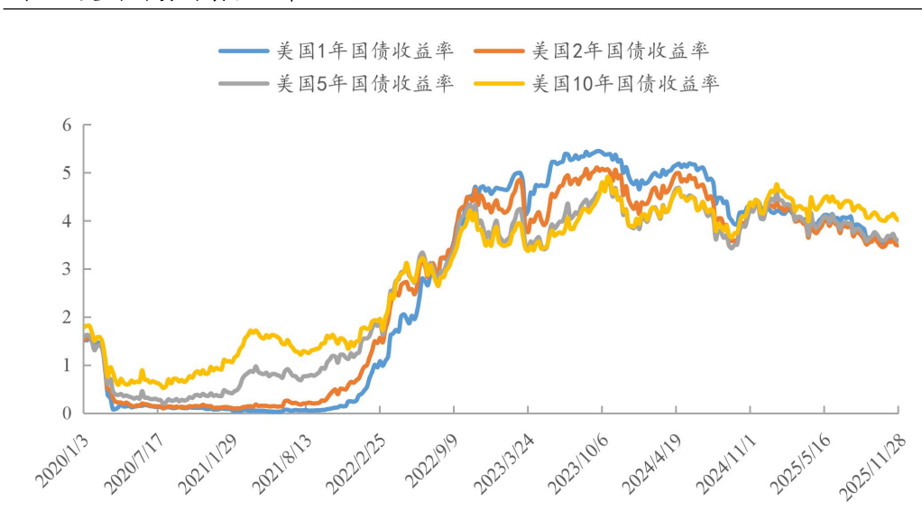
图 4：美国国债到期收益率（%）