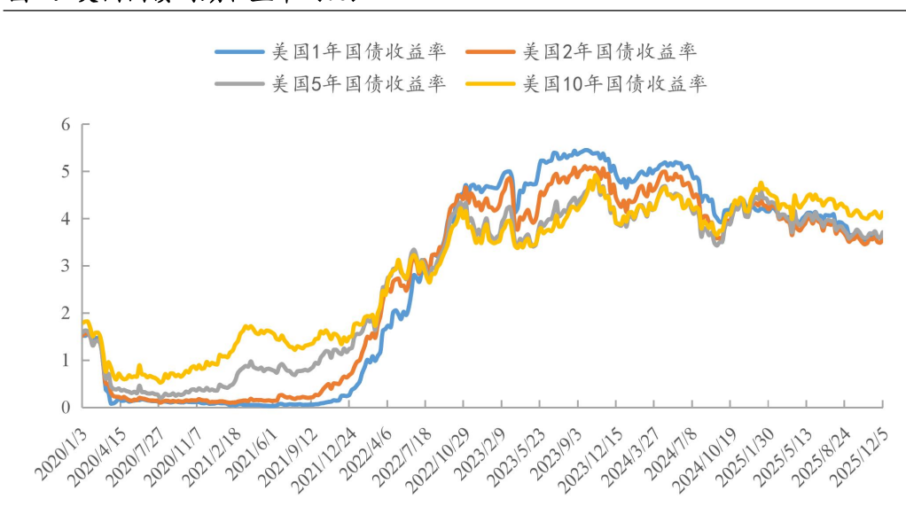
图 4：美国国债到期收益率（%）